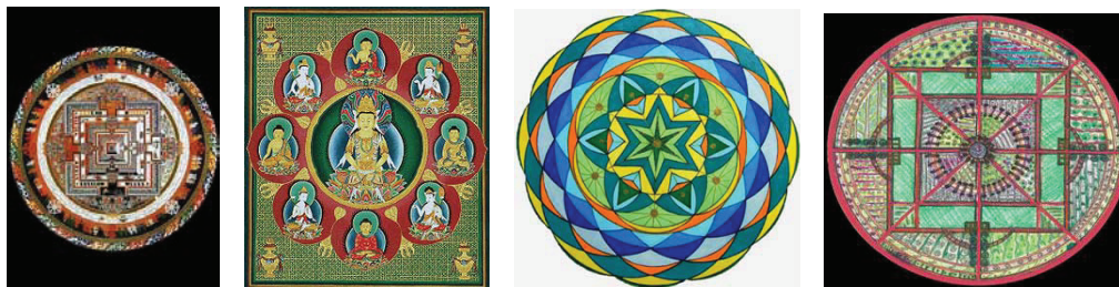
Vài thí dụ về mạn-đà-la (do người dịch thêm vào)

cho một sự thiêng liêng mang tính cách vừa tượng hình lại vừa trừu tượng, dùng làm nền tảng trợ giúp cho việc thiền định hay sự quán thấy).