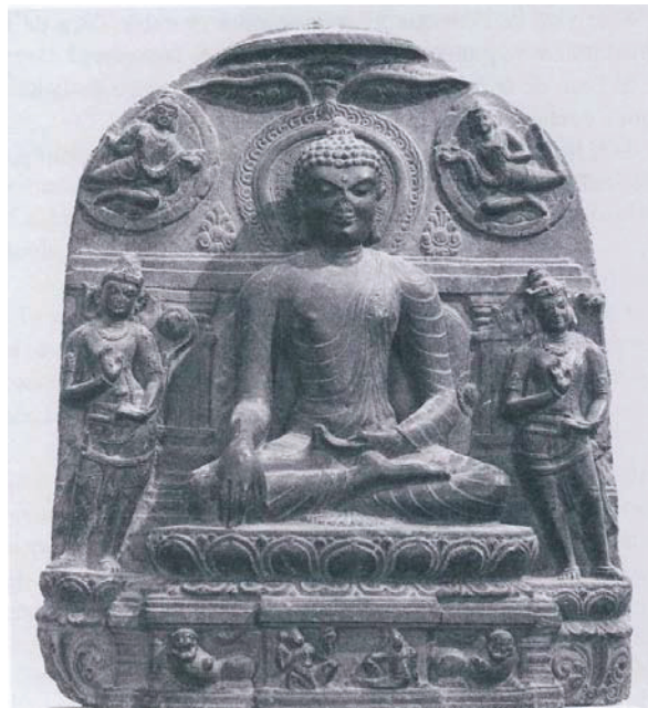
Đức Phật chạm tay xuống mặt đất để chứng minh cho sự chiến thắng của mình trước bọn ma vương (điều khắc nổi thuộc triều đại Pala-sena, Ấn Độ, thế kỷ thứ X, đá Basalt màu đen, bảo tàng viện Guimet-Paris)