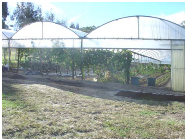
Khu nhà kiếng Đại Tông Lâm Phật Giáo cần những tấm lòng rộng mở công quả.

Biết buông bỏ đúng lúc mọi đấm nhiễm phù vân thì màu xanh của lá chính là màu xanh của tâm hồn trong cảm quan sâu lắng, biết vô thường qua đi trong mỗi giây phút sinh diệt./.