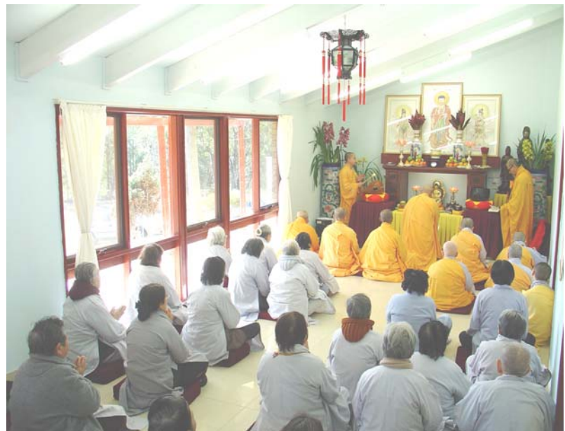
Lễ Vu Lan trên Đại Tông Lâm Phật Giáo

Mỗi cá nhân là một giá trị tiêu biểu. Mỗi thời đại là sự vận hành phát triển khác nhau. Đứng ở vị trí hiện tại phẩm định quá khứ chưa chắc đã chính xác vì quá khứ đã trôi qua. Nhìn về tương lai thì tương lai chưa tới, mọi suy nghĩ chỉ mang tính giả định.