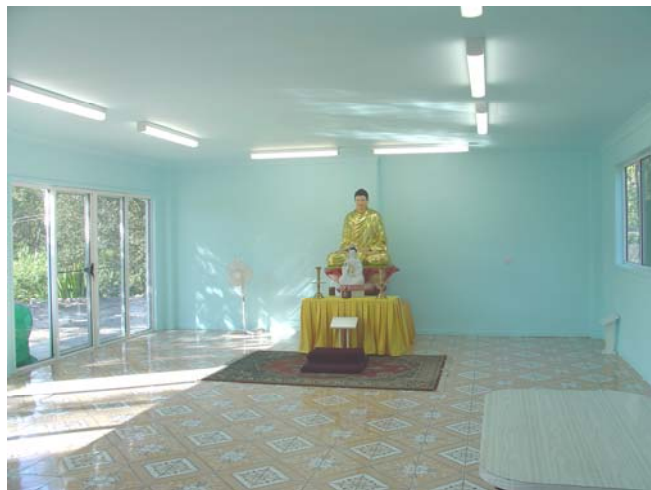
Hội trường đa dụng trên Đại Tông Lâm Phật Giáo đã được sửa sang tươm tất cho các dịp lễ và chương trình tu học.