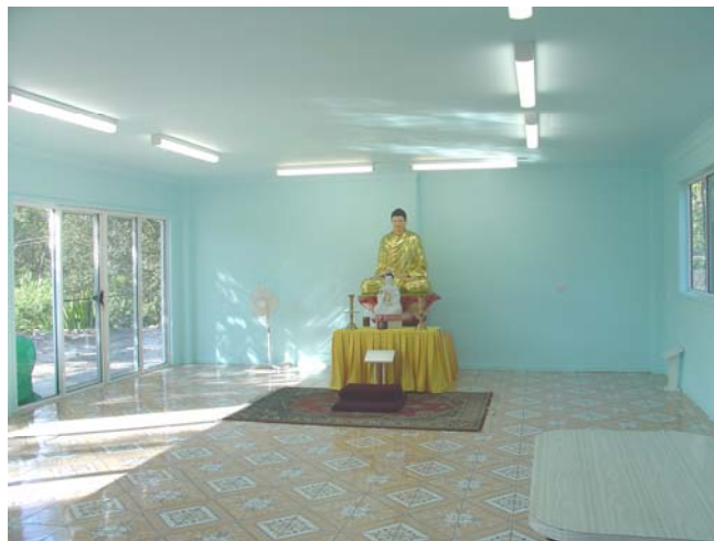
Hội trường đa dụng trên Đại Tông Lâm Phật Giáo đã được sửa sang tươm tất cho các dịp lễ và chương trình tu học.