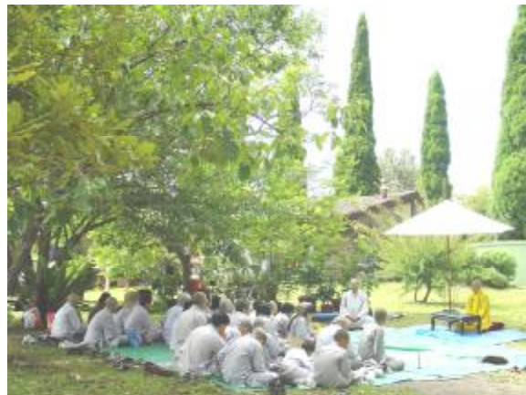
Một ngày sinh hoạt ngoài trời nơi Đại Tông Lâm Phật Giáo dành cho học chúng Khóa Tu Xuất Gia Ngắn Hạn hè 2004

Đã có 11 nước bị ảnh hưởng trực tiếp và gián tiếp từ thiên tai này. Số người tử vong lên đến trên 300,000 người. Nỗi đau đớn tột cùng của nhân loại trong những ngày cuối năm 2004, ngoài sự đau khổ và mất mát, chúng ta còn học sâu hơn về tính chất vô thường của cuộc sống mà Đức Phật đã chỉ bày từ mấy ngàn năm trước.