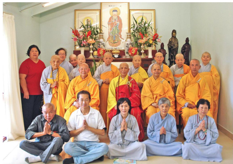
Lưu niệm Lễ Cầu An đầu năm trên Đại Tông Lâm Phật Giáo ngày 28/01/09

Đại Tông Lâm Phật Giáo, suốt trong thời gian qua, tuy chưa được chánh quyền sở tại cấp giấy phép chánh thức, nhưng Ban Kiến Thiết vẫn âm thầm hoạt động tiến hành xây dựng tu bổ qua từng bước hạn chế khiêm tốn. Và cũng trong thời gian qua, Ban Kiến thiết cũng đã cố gắng thực hiện phát hành nhiều bản tin. Mục đích là để phổ biến những tin tức cập nhật liên quan đến vấn đề sửa sang kiến thiết. Đồng thời cũng để ghi nhận công đức qua những đóng góp công sức và tài vật của chư Tôn Đức Tăng Ni và quý đồng hương Phật tử. Chính nhờ sự phát tâm đóng góp này, mà chúng tôi mới có được chút ít phương tiện để hoàn thành một số ít công việc như hiện nay quý vị đã thấy.