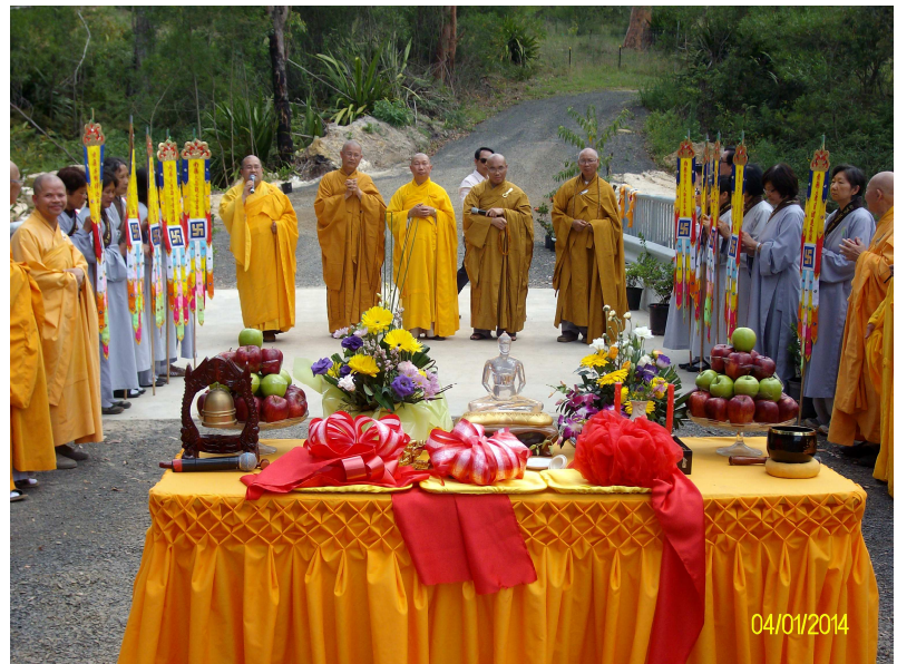
Lễ Khánh thành cầu Thanh Lương ngày 4/1/14

Năm cũ qua đi, đã để lại trong lòng nhân thế với biết bao nỗi đắng cay tang thương hệ lụy. Ngoài những chiến tranh do con người gây ra, đến những trận thiên tai hãi hùng khốc liệt giết chết biết bao sinh mạng con người và tiêu hao thiêu hủy biết bao là tài sản. Đó là những gánh nặng mà con người ngày nay luôn phải đương đầu gánh chịu. Trận bão Haiyan ở miền Trung nước Phi, là một trong những trận bão lớn nhất từ trước tới nay. Trận bão đã giết chết biết bao sinh mạng con người và tiêu tan tài vật. Cả thế giới đều bàng hoàng sửng sốt trước thảm cảnh đau thương mà do cơn bão dữ dội đã gây ra. Ngoài ra, còn có những nỗi bất an lo sợ khác của nhơn loại. Có thể nói đời sống của con người không lúc nào an ổn. Hết lo sợ nhơn tai rồi đến thiên tai. Một cuộc sống bất an như thế, thử hỏi hậu quả đó do đâu? Hẳn mỗi người đã có sẵn câu trả lời rồi vậy. Bao lâu con người còn gây ra nhiều nghiệp ác, thì bấy lâu con người vẫn còn phải chịu lắm điều hoạn họa khổ đau. Hệ quả đó, có thể nói, tất cả đều do con người gây ra. Hoặc trực tiếp hoặc gián tiếp mà thôi. Cũng như sắt sanh ra sét và chính chất sét ấy trở lại phá hủy tiêu hình của sắt. Đó là điều, thiết nghĩ, chúng ta nên ý thức và tự kiểm điểm lại chính mình.